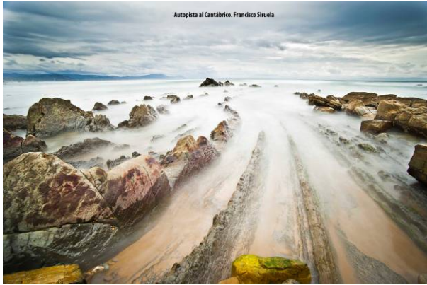
Autopista al Cantábrico. Francisco Siroela